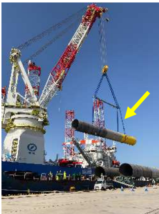
吊り具(スリング)を用いた 荷重物の運搬の様子

近年、洋上風力発電において、風力発電機の大型化が進んでいます。そのため施工に必要な吊り具(スリング)にも一層の高耐荷重化が要求されています。(株)三浦組紐工場 みうらくみひもこうじょう では、繊維スリングを構成する原糸や配置方法を検討しました。その結果、少ない糸本数での高耐荷重化に成功し、世界最大級となる700t超の荷重物を吊り下げ可能なスリングの生産を可能としました。