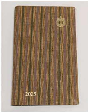
2025年版愛知県手帳限定版 (三河木綿)の表紙

県統計協会が発行する愛知県手帳の表紙に、地域ブランドの「三河木綿」を用いた限定品です。