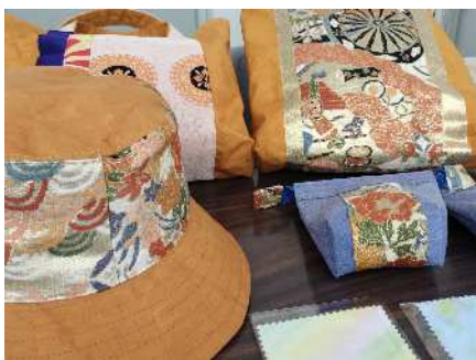
三河帯心のリメイク製品

西尾市を中心とする三州地域は、高級帯芯として知られる三河帯芯 ※6 の産地です。しかし、製造工程で発生する織りキズが僅かでも発生すると二級品(通称B反)となってしまいます。本展示では、商品価値が低下した三河帯芯の再利用を試み、バッグやコースター等にリメイクしました。染色した帯芯や帯の端材を組み合わせ、新たな製品として提案します。